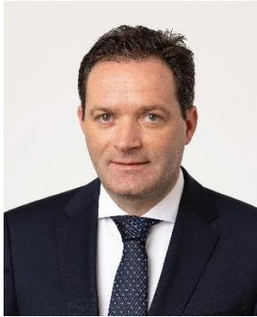
Mag. Norbert Totschnig, MSc Bundesminister

Der Klimawandel zählt zu den größten Herausforderungen des 21. Jahrhunderts. Wir stellen uns dieser Aufgabe auch in der Siedlungswasserwirtschaft mit aller Entschlossenheit und sehen es nicht nur als eine moralische Verpflichtung, sondern auch als eine große Chance. Wer sich schon früh als internationaler Vorreiter positioniert, schafft zukunftssichere Arbeitsplätze und neue Exportmöglichkeiten.